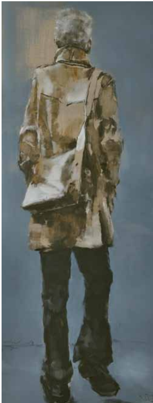
"Londres". Óleo / lino. 180 x 70 cm. 2011