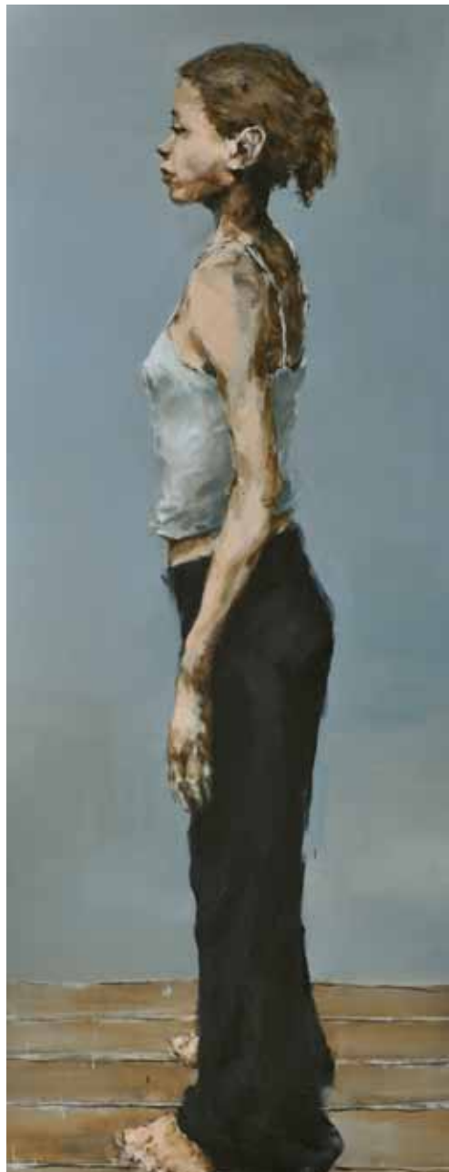
"Una de dos, I" Óleo / tela. 180 x 70 cm. 2011