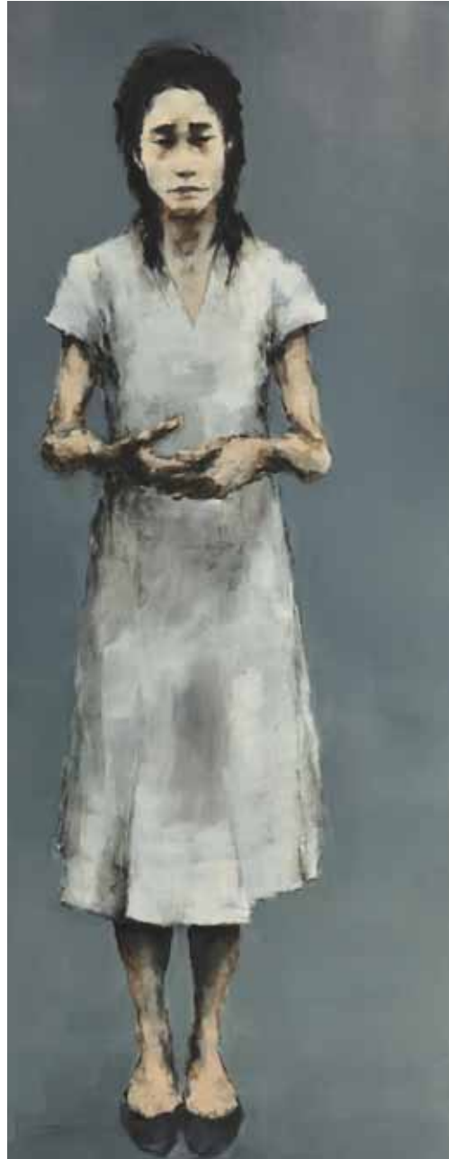
"Empty-handed Kannon". Óleo / tela. 180 x 70 cm. 2011