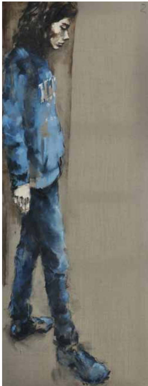
"Step forward". Óleo / lino. 180 x 70 cm. 2011