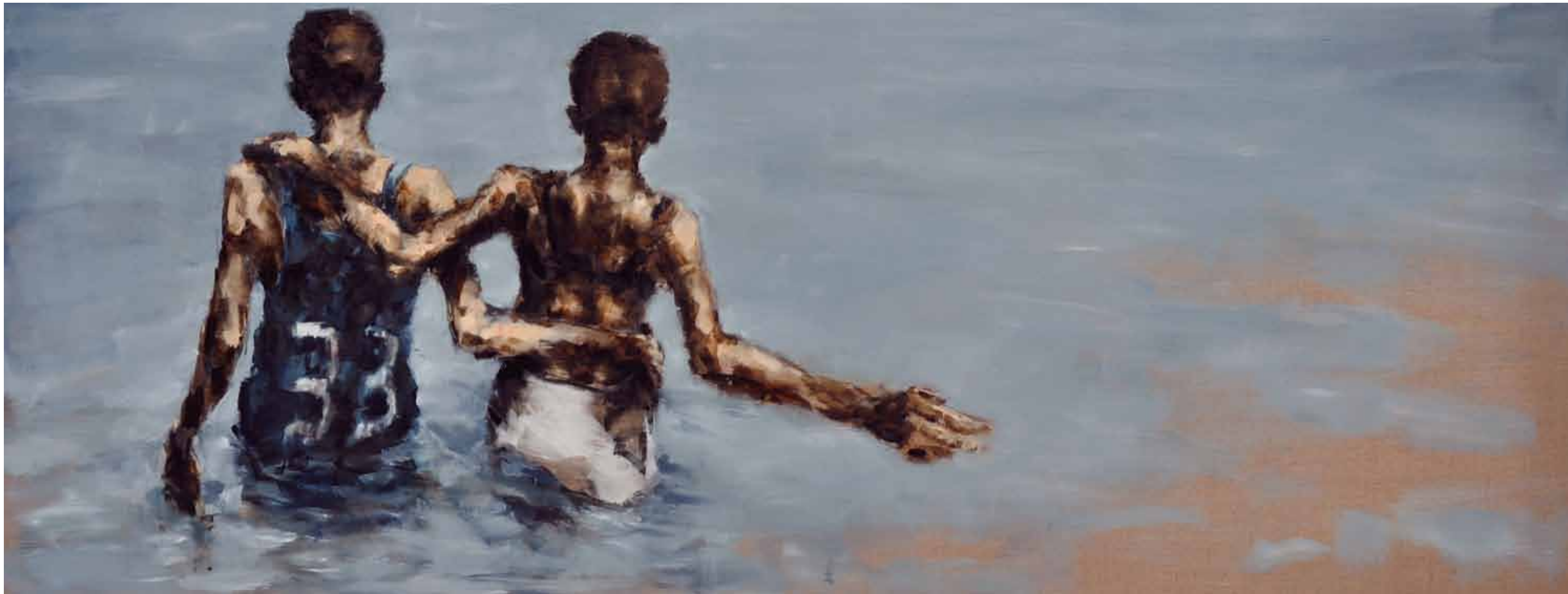
"Flood" . Óleo / tela. 70 x 180 cm. 2011