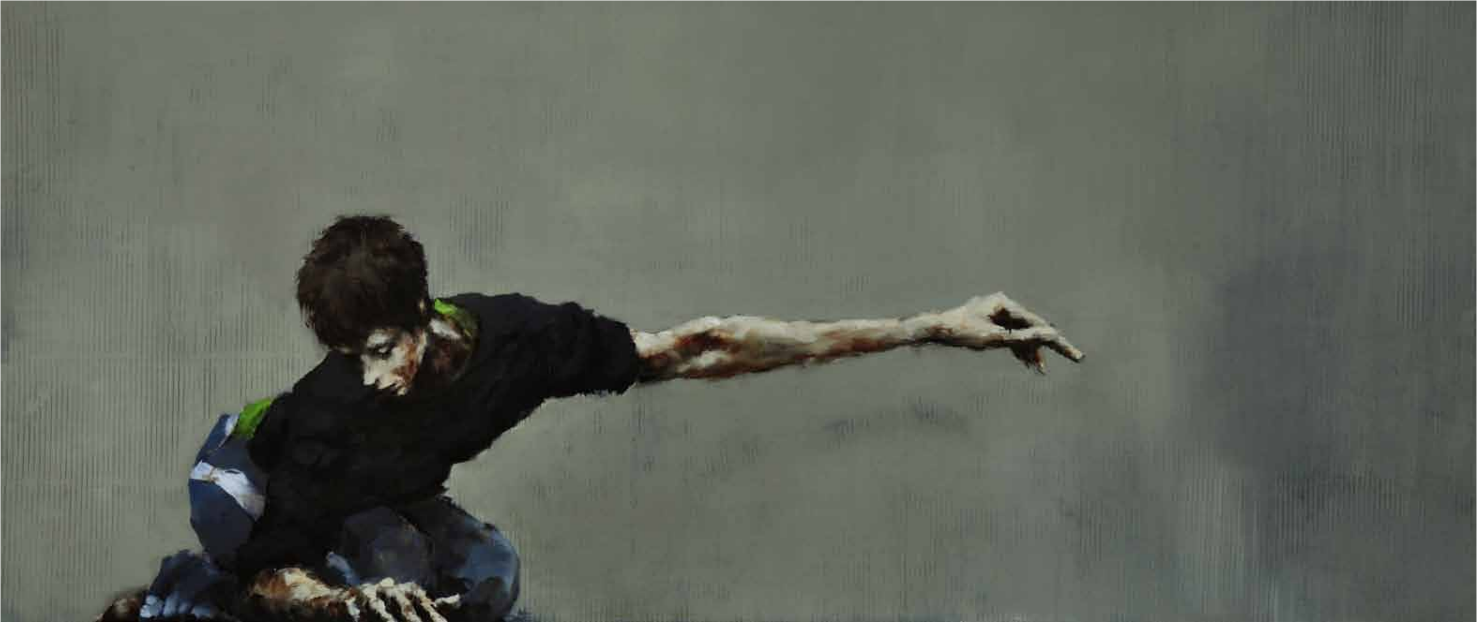
"Tabernacle, I (Elena Gianotti)". Óleo / lino. 82 x 180 cm. 2011