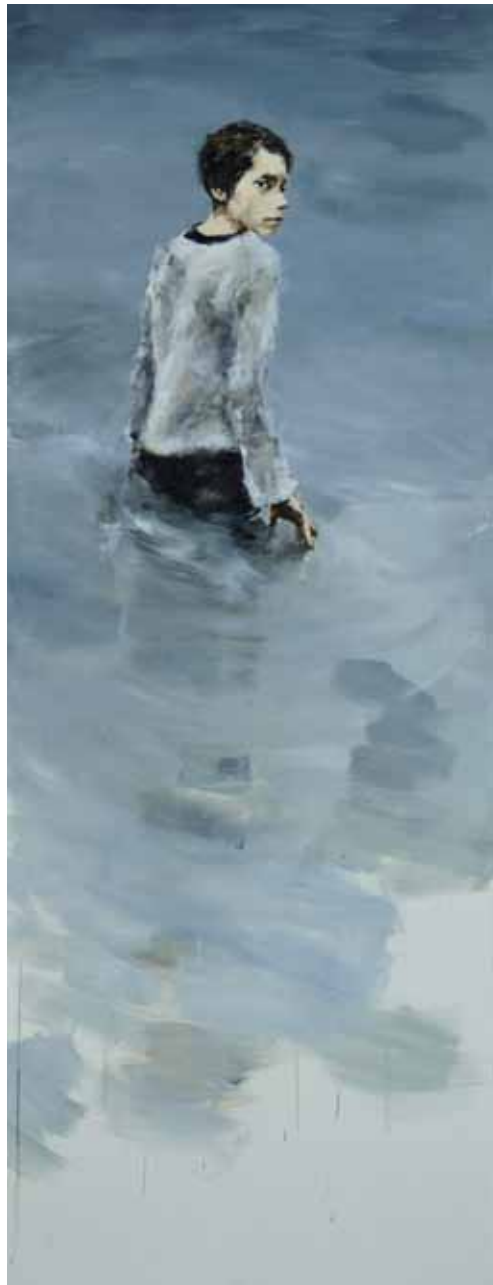
"Lake - swimming". Óleo / lino. 180 x 70 cm. 2011