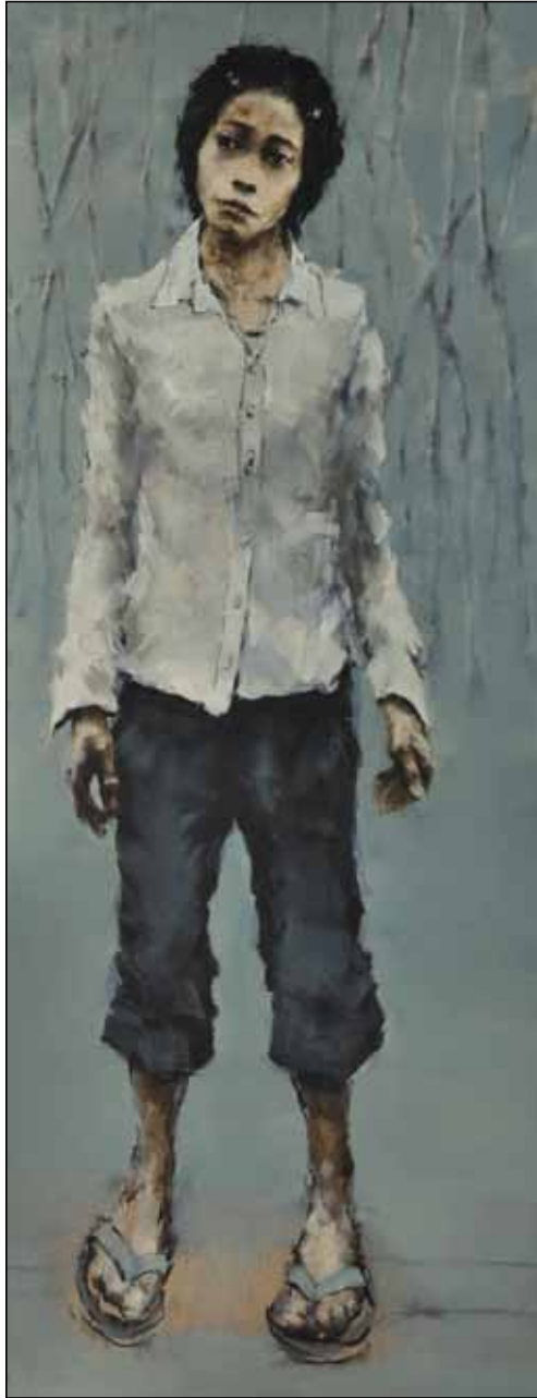
"Les saigneurs, II". Óleo / lino. 180 x 70 cm. 2011