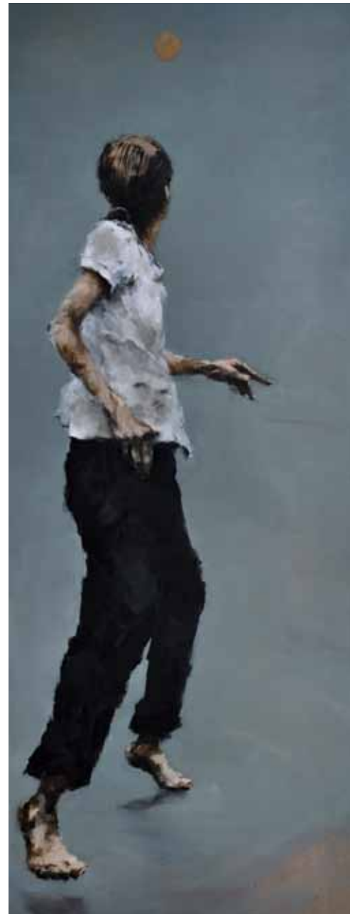
"Turning back". Óleo / lino. 180 x 70 cm. 2011