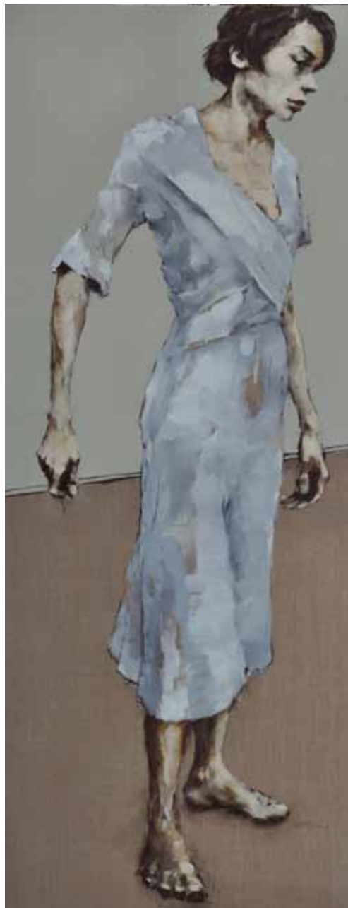
"Lisboa". Óleo / lino. 180 x 82 cm. 2011