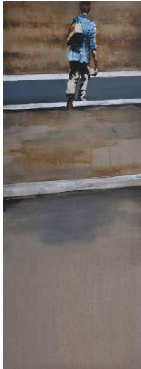
"Para Coetzee". Óleo / lino. 180 x 70 cm. 2011