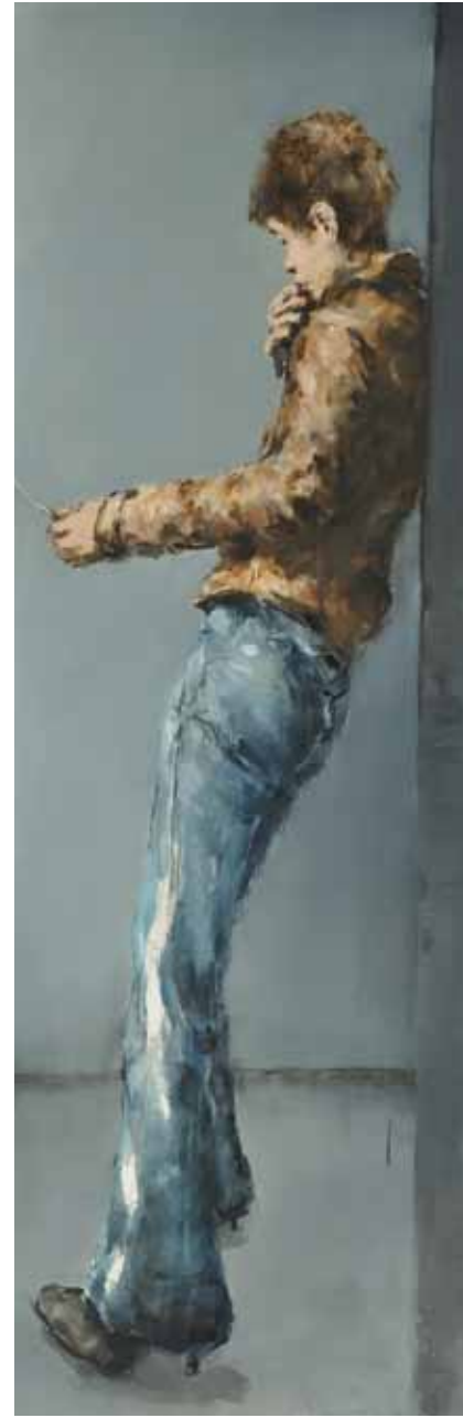
"Phone-booth". Óleo / tela. 180 x 70 cm. 2011