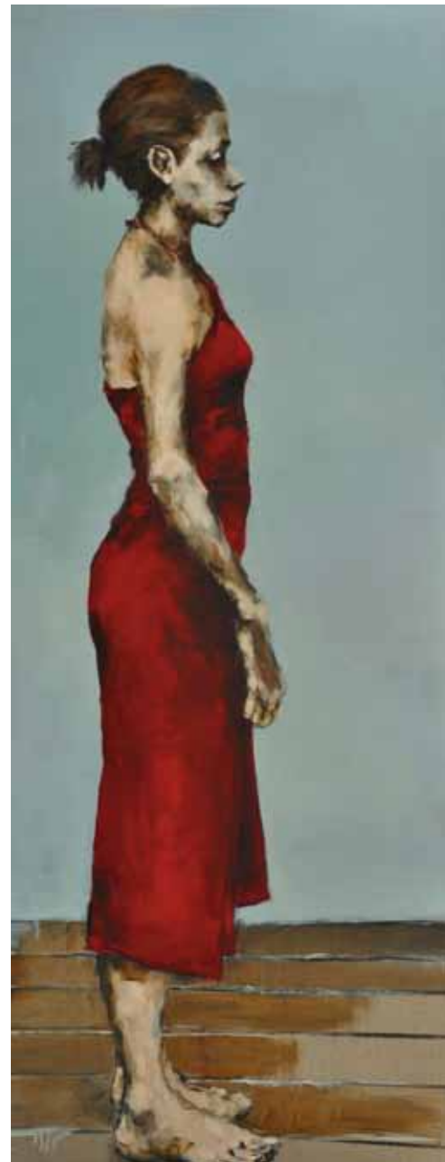
"Una de dos, II" Óleo / tela. 180 x 70 cm. 2011