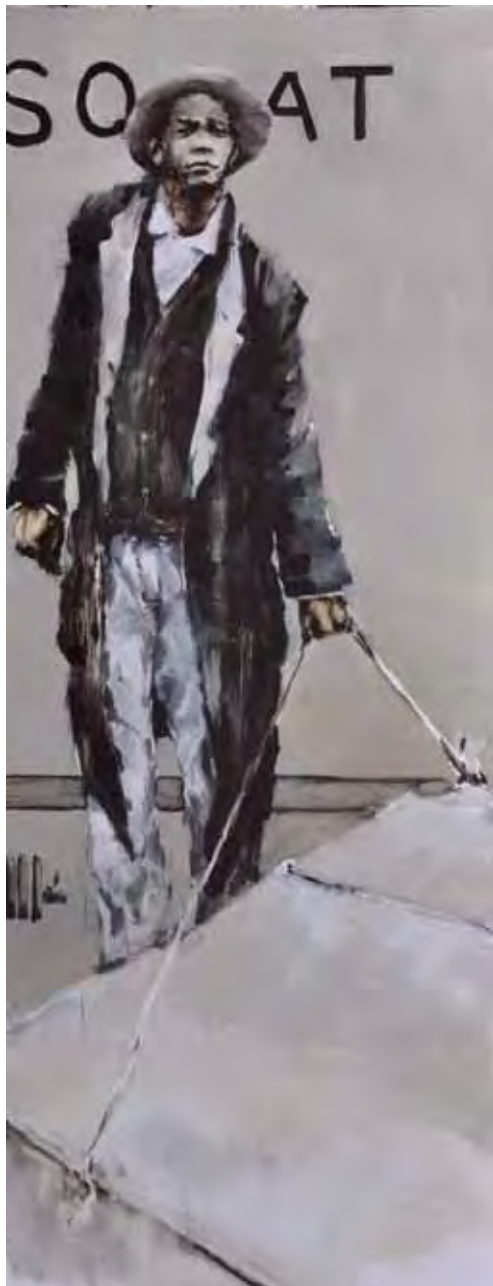
"La losa (Basquiat)". Óleo / tela. 180 x 70 cm. 2011