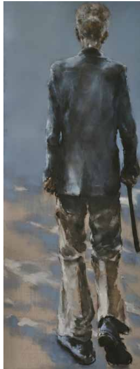
"S.B., Paris". Óleo / lino. 180 x 70 cm. 2011